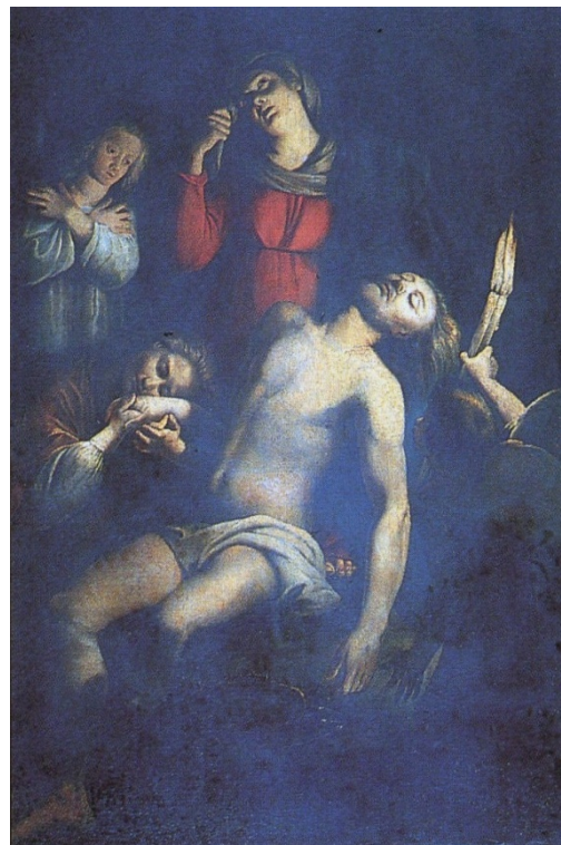
Fig. 2 - Jacques Casell, Pieta.