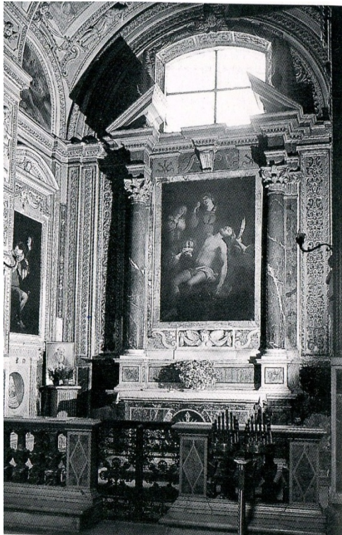
Fig. 1 - Rome, Santa Maria in Aquiro, chapelle de la Passion.